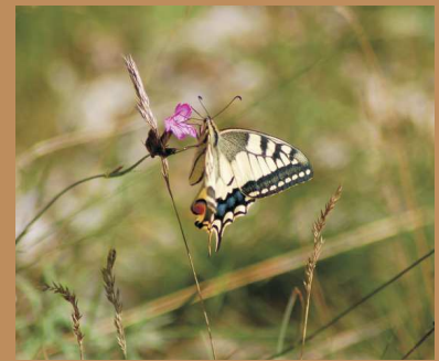
Schwalbenschwanz ( Papilio machaon ) auf einer Karthäuser Nelke ( Dianthus carthusianorum )

“Über und durch die Altwarper Wüsten” immer dienstags 10:00 Uhr –Treffpunkt an der Touristeninformation im Hafen Altwarp – vorherige Anmeldung unter 039779 – 296810, oder 039771 -28484 erforderlich. (Juli / August auch ohne Anmeldung)