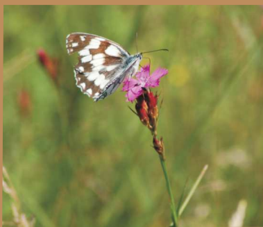
Schachbrettfalter ( Melanargia galathea ) auf einer Karthäuser Nelke ( Dianthus carthusianorum )

– Nein, na dann lassen Sie sich doch einmal von einem der Naturpark-Ranger in unsere Wüstenwelt entführen. Jeden Dienstag (von Mitte Mai bis Mitte September) können Sie die Weiten der Altwarper Wüsten- (Binnendünen-) landschaft kennen lernen. Auch wenn es sich zugebener Maße nicht wirklich um Wüsten handelt, herrschen hier mitunter wüstenähnliche Verhältnisse. So kann sich die Dünenoberfläche an einem sonnigen Sommertag auf mehr als 50°C erwärmen. Dennoch gibt es Leben auf und in den Binnendünen. Welche Tier- und Pflanzenarten sich auf diesen Lebensraum spezialisiert haben und vor allem wie die Dünen in die Landschaft gekommen sind erfahren sie auf einem kurzweiligen Spaziergang mit fachkundiger Begleitung, außerdem erhalten Sie fantastische Ein- und Ausblicke in die Landschaft - probieren Sie es einfach mal aus.