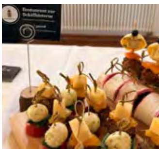
Kulinarisch hat das Restaurant „Zur Schiffslaterne“ die Veranstaltung begleitet.