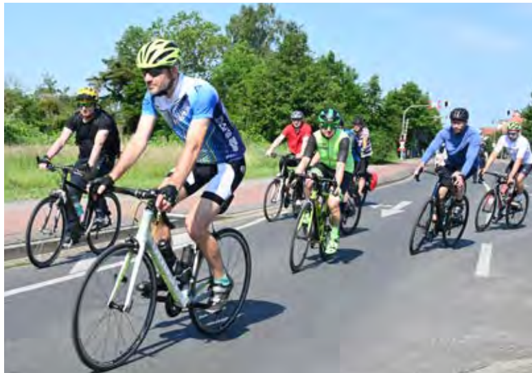
Die Rennradtour führt entlang der deutsch-polnischen Grenze.

Besondere Highlights sind das Interview mit Lars Riedel, fünf-facher Weltmeister und Olympiasieger im Diskuswerfen, der persönliche Einblicke in die Welt des Leistungssports geben wird, sowie die abendliche Ausfahrt mit der Pommernkogue UCRA.