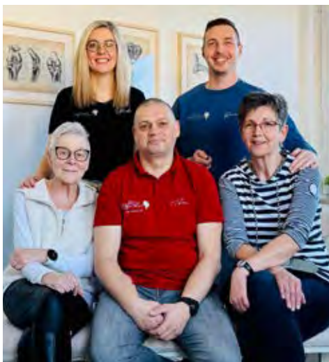
Das Torgelower Team freut sich über die neu hergerichteten Räumlichkeiten.