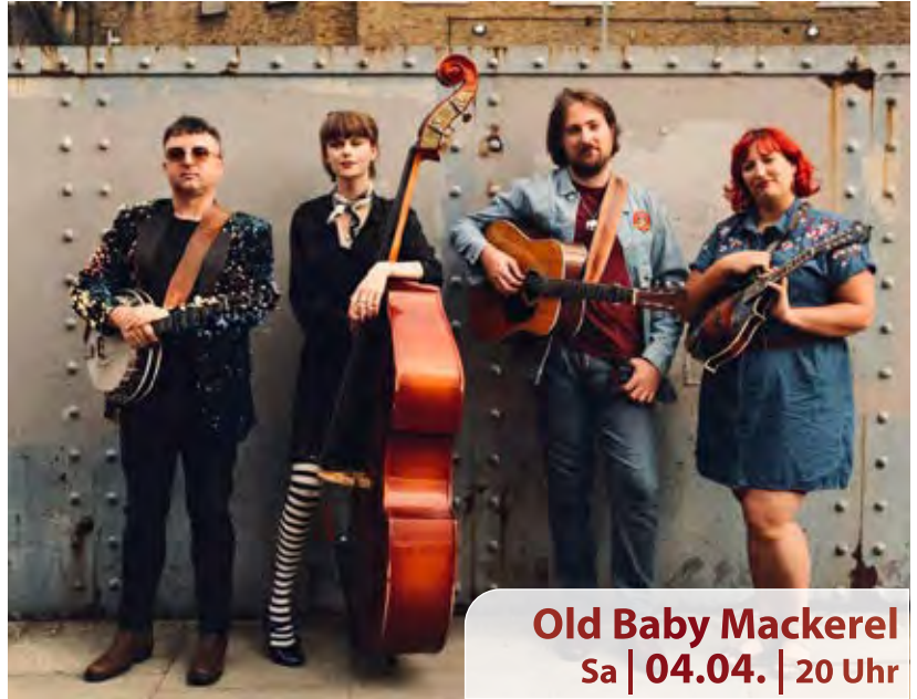
Old Baby Mackerel Sa | 04.04. | 20 Uhr

Die Band besteht aus renommierten Musikerinnen und Musikern aus einigen der bekanntesten britischen Folk- und Americana-Formationen. Dass sie ihr Handwerk meisterhaft beherrschen, bestätigen auch Stimmen aus der Szene: „So, so good!“, urteilte Adam Crowther von BBC Radio Bristol, und Festivalorganisator