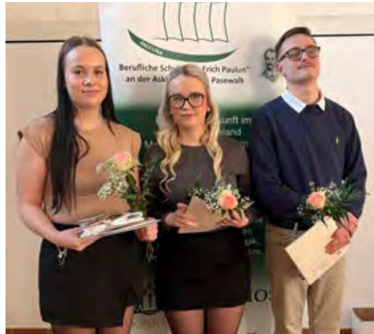
Diese Absolventinnen und Absolventen erhielten ihr Zeugnis in Pasewalk. Ein feierlicher Tag.