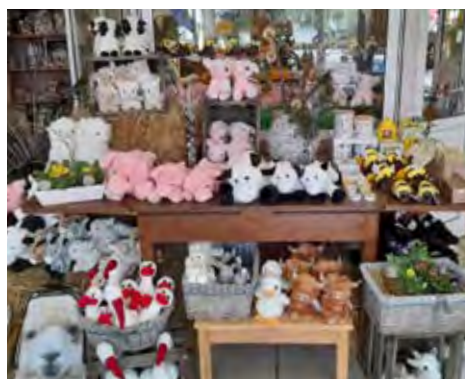
Der Zoovenirshop hat einiges zu bieten – zum Beispiel diese kuscheligen Tierchen.