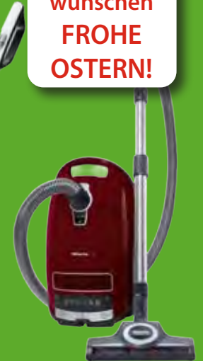
Akku- und Bodenstaubsauger