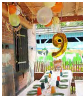
Geburtstag feiern im Tierpark – ein tierisches Erlebnis.

Schaut auch gern mal im Zoove-nirshop vorbei, da lässt sich allerhand entdecken. Dort findet Ihr bestimmt die eine oder andere schöne Erinnerung an Euren Tierparkbesuch. uh