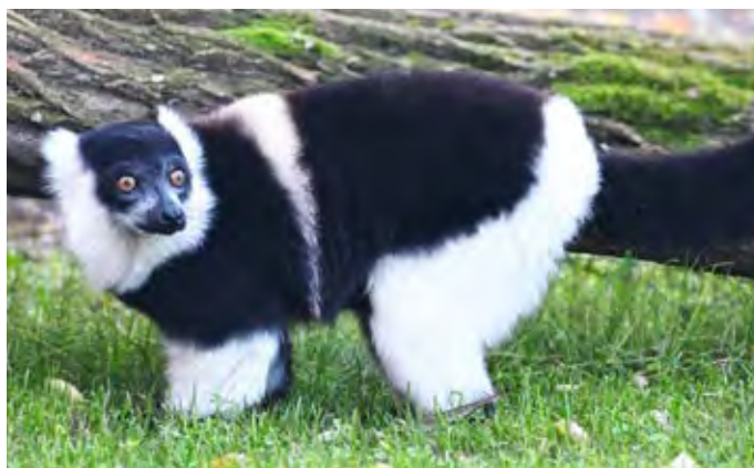
Die Schwarz-weißen Varis im Zoo am Haff suchen ihre Tierpaten.

Zu den Highlights zählt die begehbare Voliere , in der Besucherinnen und Besucher den Vögeln ganz nah kommen können. Auf dem liebevoll gestalteten Erlebnisbauernhof geht es nostalgisch zu – hier darf sogar mit alten Traktoren durch das Gelände getuckert werden. Im Streichelgehege freuen sich zutrauliche Ziegen auf sanfte Streicheleinheiten. Auch die zahlreichen Spielplätze erwachen aus dem Winterschlaf: Ein großer Abenteuerspielplatz am Affenwald lädt zum Klettern und Toben ein, am Känguruge-