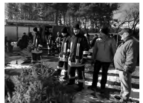
Fachgerecht wurden die Bäume verbrannt.