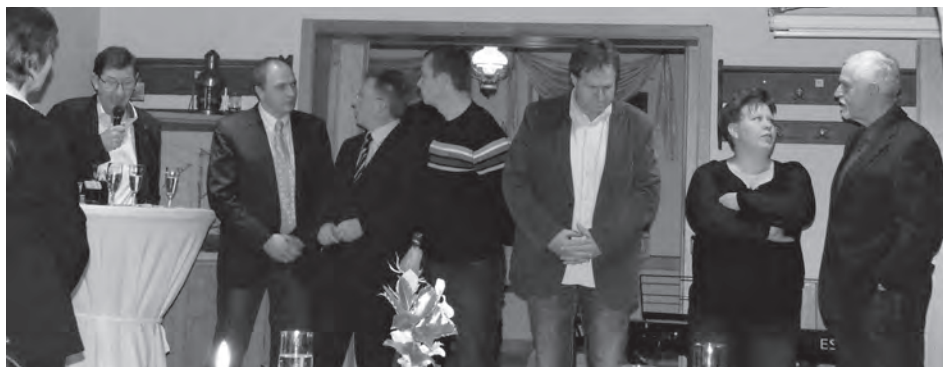
Viele anregende Gespräche gab es zum Neujahrsempfang.