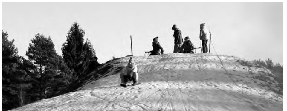
Sichtlich viel Spaß hatten nicht nur die kleinen Gäste auf dem Rodelberg.