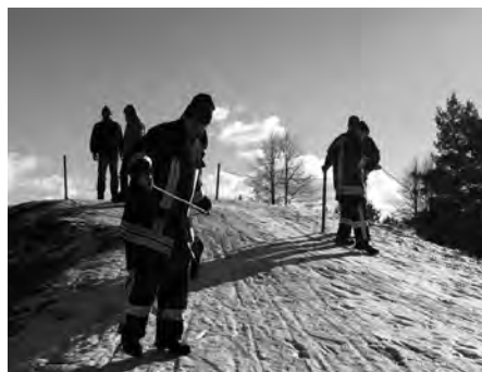
Die Feuerwehr bereitete die Piste vor.

Ursprünglich hatten die Meiersberger geplant, am 10. Januar das Weihnachtsbaumverbrennen durchzuführen, aber wegen Sturm und Regen wurde der Termin abgesagt. Spontan entschied man sich, den kurzen Winterereinbruch dafür zu nutzen und es hat am 8. Februar gerade noch so geklappt. Die Piste auf dem Rodelberg war vereist, so dass die Feuerwehr kurz entschlossen Pfosten einrammte und Seile spannte und schon konnte mit dem Rodelspaß begonnen werden. Am nächsten Tag setzte Tauwetter ein. Ein Dank an alle Helfer!