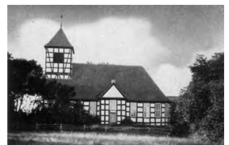
Kirche Luckow vor 80 Jahren

Am 25. Februar findet eine Zusammenkunft mit Vertretern der polnischen Nachbargemeinde Nowe Warponow (Neuwarp) statt.