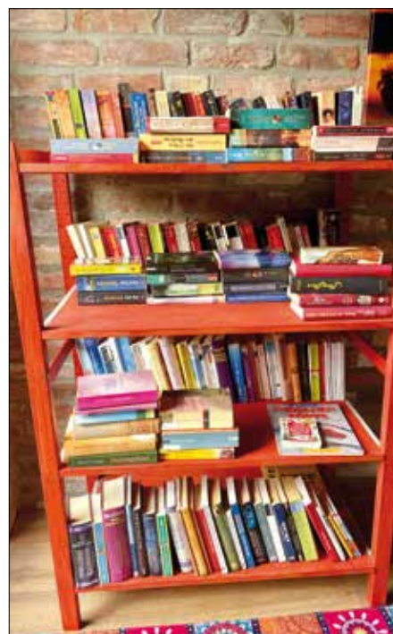
Die Bücherecke ist schon gut bestückt.