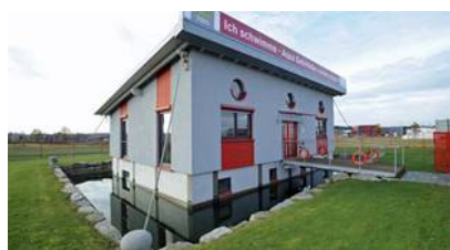
Bsp.: „weiße Wanne“