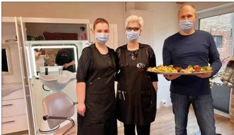
Der Friseur nimmt seine Tätigkeit im Multiplen Haus auf.