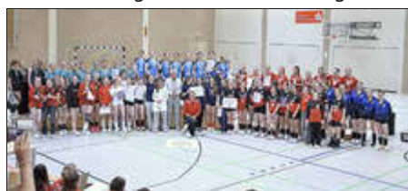
alle Teams bei der Siegerehrung