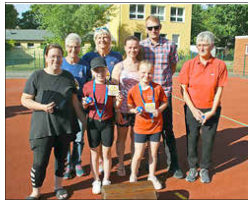
Das Siegerteam mit den Gutscheinen

jongliert bzw. Hampelmänner gezählt. Gewertet wurden Anzahl, Meter und Sekunden an den einzelnen Stationen und daraus die Sieger und Platzierten ermittelt. Dadurch konnten die Gold-, Silber- und Bronze-medallengewinner ermittelt werden. Sieger wurde das Team „Dragonpower“.