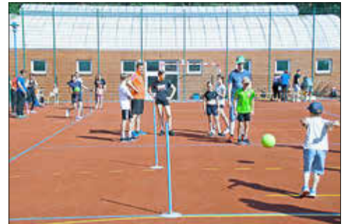
aktive Bewegung an den Stationen

Die sportlichen Übungen sind mit Geschick, Schnelligkeit und Kraft für Klein und Groß gut zu bewältigen. So wurden die eigenen Schuhe weit geworfen, Bälle von A nach B transportiert oder auf den Handrücken um Stangen