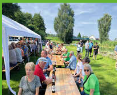
Musikalischer Frühschoppen 2025

Wir freuen uns auf ein gemütliches Beisammensein. Für das leibliche Wohl wird am Grill und Getränkestand gesorgt. Die Gemeinde Grambin unterstützt uns materiell.