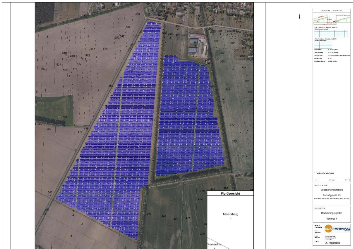
Abbildung 2: Belegungsplan Agri-PV -Anlagen

Für die Agri-PV-Anlage wird ein Freiraumbeträchtigungsgrad von 0,75 zum Ansatz gebracht. Für die Umsetzung der erforderlichen Kompensationsmaßnahmen werden im Zuge der Bauleitplanung Maßnahmen zum Schutz, zur Pflege und zur Entwicklung von Natur und Landschaft abgestimmt, ausgewiesen und festgeschrieben.