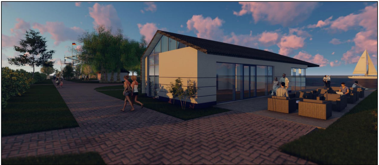
Abbildung 3: Visualisierung des Ersatzneubaus der Strandhalle als gastronomische Einrichtung

Darüber hinaus ist ein Ersatzneubau der Strandhalle als gastronomische Einrichtung zwingend erforderlich, weil sich der bauliche Bestand in einem schlechten Zustand befindet.