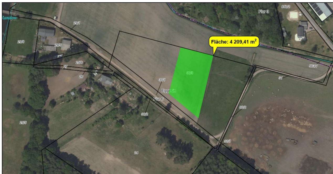
Abbildung 2: Lage der Kompensationsmaßnahme

Auf dem Flurstück 30/3 der Flur 6 in der Gemarkung Eggesin soll die Umwandlung von Acker durch spontane Begrünung in Dauergrünland als Weide erfolgen.