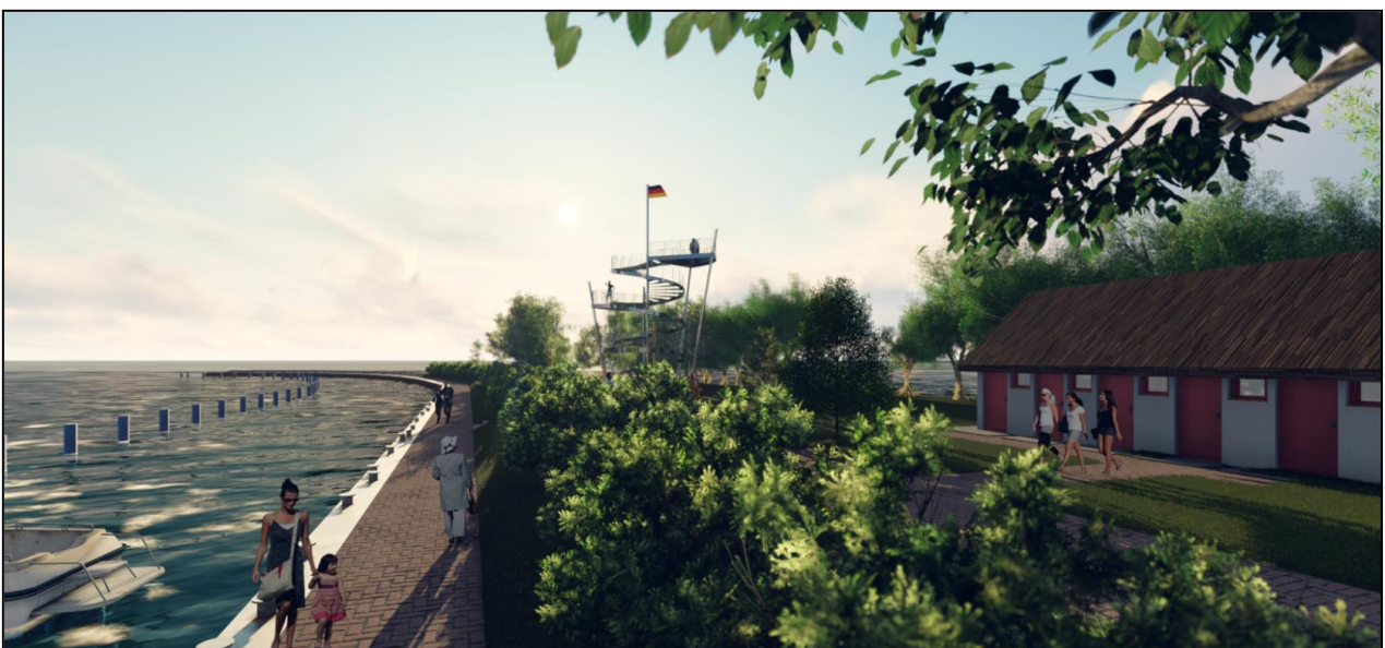
Abbildung 4: geplanter Aussichtsturm und erweitertes Sanitärgebäude, visualisiert