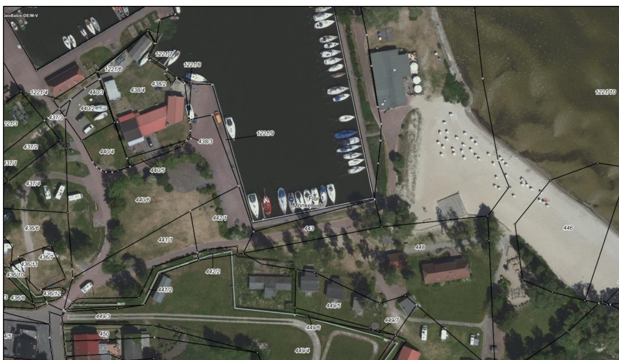
Abbildung 1: Luftbild mit Darstellung des Planungsraumes

Eine Spundwand aus Stahlprofilen durchzieht als Hochwasserschutzanlage der Ortslage Mönkebude den gesamten südlichen Planungsraum. Mit etwa 2,50 m über HN 76 überragt diese Spundwand das natürlich anstehende Gelände um gut 1,80 m. Nördlich dieser Spundwand bestehen bereits Ferienhäuser und das Gebäude der ehemaligen Gaststätte. Der bauliche Zustand lässt eine Nutzung durch Feriengäste jedoch nicht mehr zu.