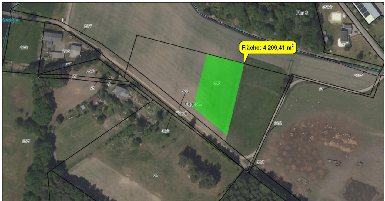
Abbildung 2: Lage der Kompensationsmaßnahme

Auf dem Flurstück 30/3 der Flur 6 in der Gemarkung Eggesin soll die Umwandlung von Acker durch spontane Begrünung in Dauergrünland als Weide erfolgen.